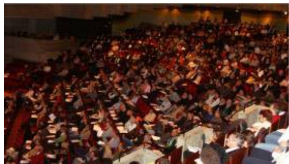
(Audimax der Universität Regensburg)

Überblick über das Verfahren und der Motivation für die Neuentwicklung, um den Anwendern den Integrationsgedanken zwischen der Planung, Bewirtschaftung, Kosten und Leistungsrechnung und kassenmäßigen Handhabung der Haushaltsmittel nahezubringen. Danach folgten Live-Demonstrationen der Verfahrenskomponenten Benutzerverwaltung und Mittelplanung und -bewirtschaftung. Weitere Vorträge gaben Einblicke in die Perspektiven der Kosten- und Leistungsrechnung mit IHV sowie in die technischen Hintergründe.